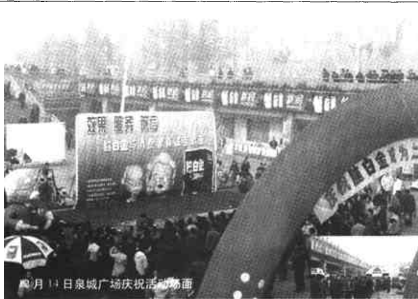
12月14日泉城广场庆祝活动现场

12月14日上午,“热烈庆祝脑白金成为上市公司著名品牌暨真诚回报消费者活动”,在省城泉城广场隆重举行。脑白金转入上市公司,意味着管理更严谨,运作更规范、产品质量更稳定,对消费者服务更到位、品牌维护更长久。本次活动得到脑白金老消费者的积极响应(见左图)。世间自有公道付出总有回报说到就要做到要做就做最好活动结束时,一曲步步高证明了脑白金长期以来坚定、坚持“效果、服务、诚信”理念,得到消费者加倍喜爱。脑白金春节市场将一路曙光。(新华)