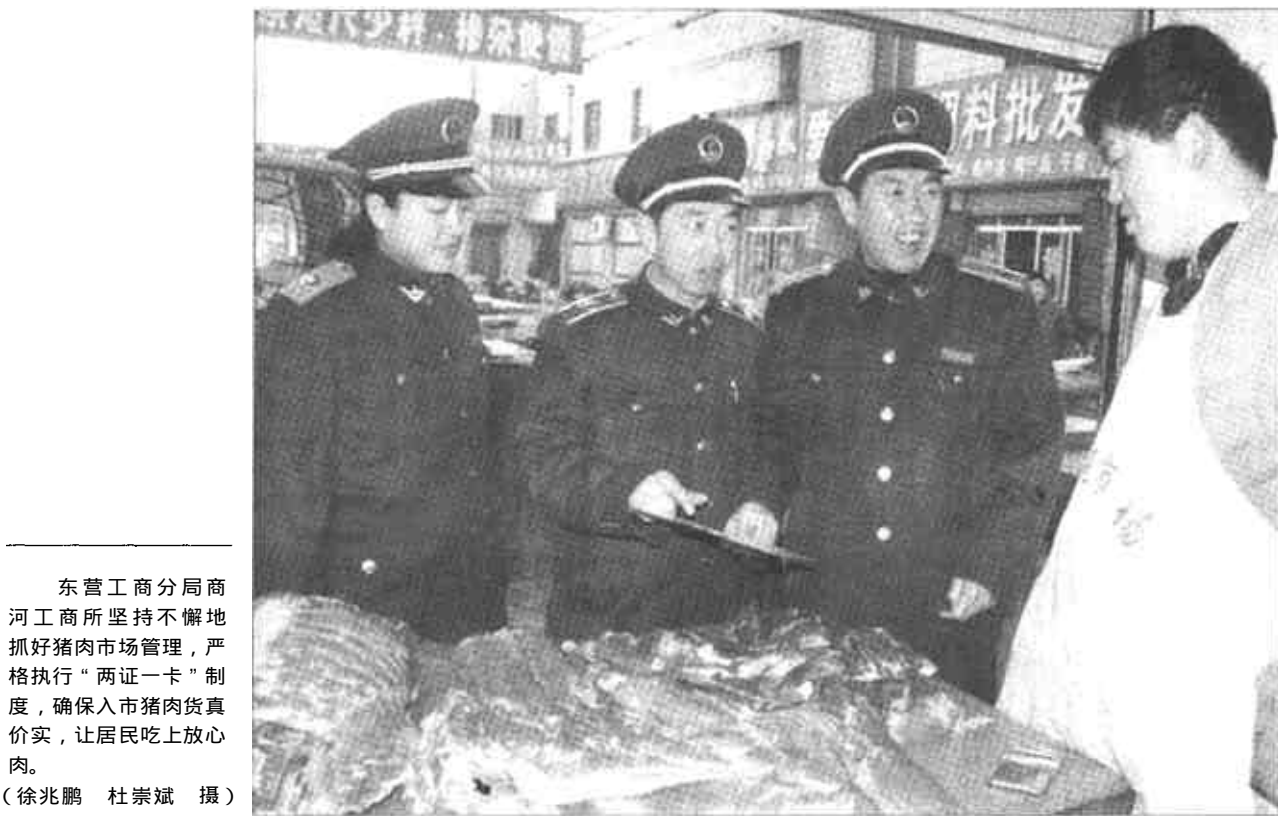
东营工商分局商河工商所坚持不懈地抓好猪肉市场管理,严格执行“两证一卡”制度,确保入市猪肉货真价实,让居民吃上放心肉。

活动中各单位自觉做到“五个促进,五个结合,实现五个提高”。即:活动同促进安全驾驶“一岗一责制”的落实相结合;提高驾驶员的安全意识和素质,同促进车辆安全技术状况相结合;提高车辆的完好率,同促进安全管理措施的落实相结合;提高科学的安全管理运行机制,同促进各办公室“三交一封”的管理相结合;提高安全管理和群体效益,同促进加强安全行车教育相结合,提高驾驶员的遵章安全意识,识别险情,预防事故安全行车的行为。自开展活动以来,各单位驾驶员自觉遵章行车,文明驾驶蔚然成风。(刘童田 任龙华 卢春玲)